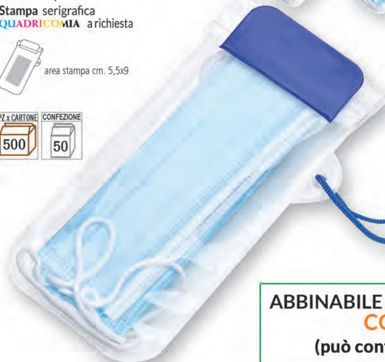
10 blu royal

ABBINABILE ALLA MASCHERINA COD. B010 (può contenere max Pz3)