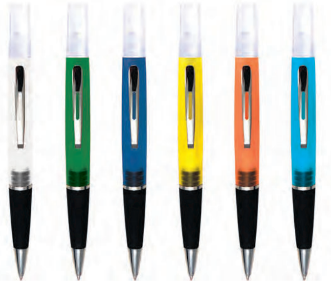
01 bianco 04 verde 05 blu navy 06 giallo 07 arancio 10 blu royal